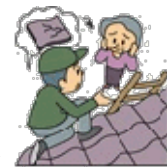
訪問販売のトラブル

最近、市内で「お宅の屋根が傷んでますよ」と知らない訪問販売業者に言われて高額請求をされる事例がけっこう出ているようです。一人暮らしのお年寄りの場合は、 契約する前に地区担当の民生委員に相談するか、契約トラブル等で困ったときは一人で悩まずに“消費者ホットライン”局番なしの“188”に相談してください。