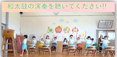
和太鼓の演奏を聴いてください!!

久しぶりにお会いして話も弾み、終始和気あいあいとした和やかな雰囲気で行うことができました。来年も元気で参加できるように願っています。