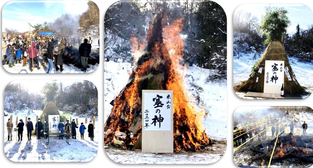
協賛: 米山台町内会、消防団、子ども会、十五日会

ホームページの行事の”どんど焼き”のところに制作過程の写真を含めて掲載しています!!